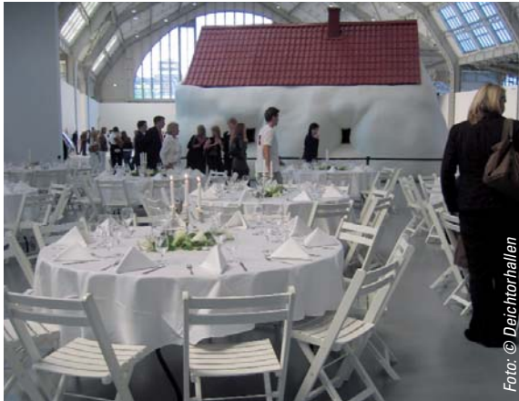
Exklusives Dinner während der Erwin-Wurm-Ausstellung

stellung/Entleihe von technischer Ausstattung, Vergünstigungen und Rabatten beim Wareneinkauf bis zur umfangreichen finanziellen und marketing-orientierten Unterstützung einer Ausstellung. Entsprechend dem Engagement der Firmen werden Gegenleistungen angeboten.