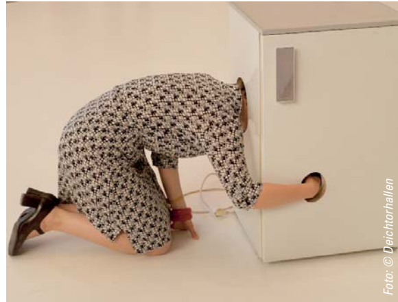
Eine Besucherin realisiert eine „One Minute Sculpture“ von Erwin Wurm „Keep a cool Head“, - dank Epson fotografisch festgehalten.

Für Erwin Wurm (geb. 1954), der heute zu den erfolgreichsten Gegenwartskünstlern zählt, kann alles zur Skulptur werden: Handlungen, geschriebene oder gezeichnete Anweisungen oder selbst ein Gedanke. Der Künstler thematisiert Schlankeitswahn und Fettsucht, Mode, Werbung und Konsumkultur, zu dessen zentralen Fetischen das Eigenheim und auch das Auto zählen. Er ist der Erfinder der „One-Minute-Sculptures“, die u.a. von den Red Hot Chili Peppers in einem Musikvideo verwendet wurden.