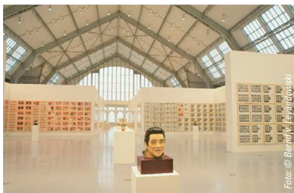
Die nördliche Deichtorhalle während der Hanne-Darboven-Ausstellung

wie große internationale Kunstsammlungen wie die Sammlung des Centre Pompidou (1990) oder die Sammlung Goetz (1998/99) gezeigt.