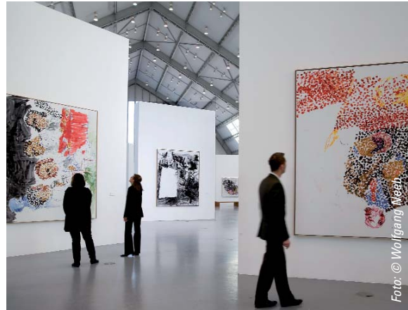
Blick in die Georg-Baselitz-Ausstellung in den Deichtorhallen

Über die Aktivitäten während der Preview hinaus wurde den Sponsoren eine Beteiligung an einem dreiminütigen Webfilm angeboten. Georg Baselitz selbst führt in diesem im Gespräch mit dem Direktor der Deichtorhallen, Robert Fleck, durch seine Ausstellung. Der Film wird auf der Webseite der Deichtorhallen präsentiert, wurde aber auch in den Online-Auftritten von YouTube, MySpace und WELT online erfolgreich platziert. Im Abspann sind die beteiligten Sponsoren erwähnt. Zudem konnte